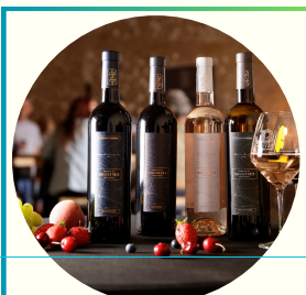
VINS ET COFFRETS CADEAUX

Nos partenaires des Rendez-vous Gourmands